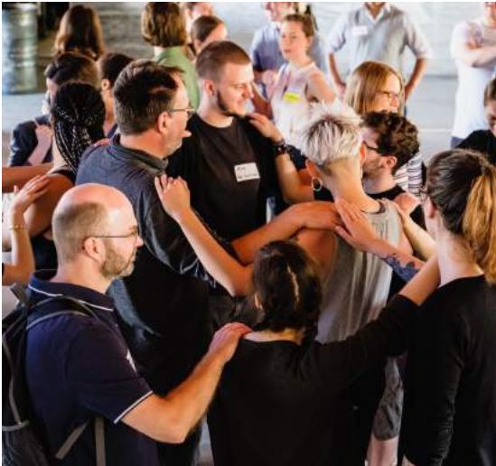
NETTZ Community Event 2019