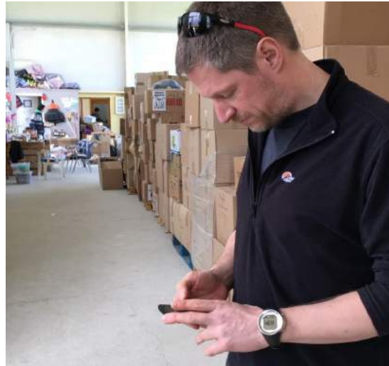
Lab Around The World: Digitale Flüchtlingshilfe