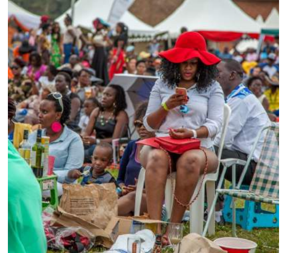
Uganda: Human Rights in the Digital Age