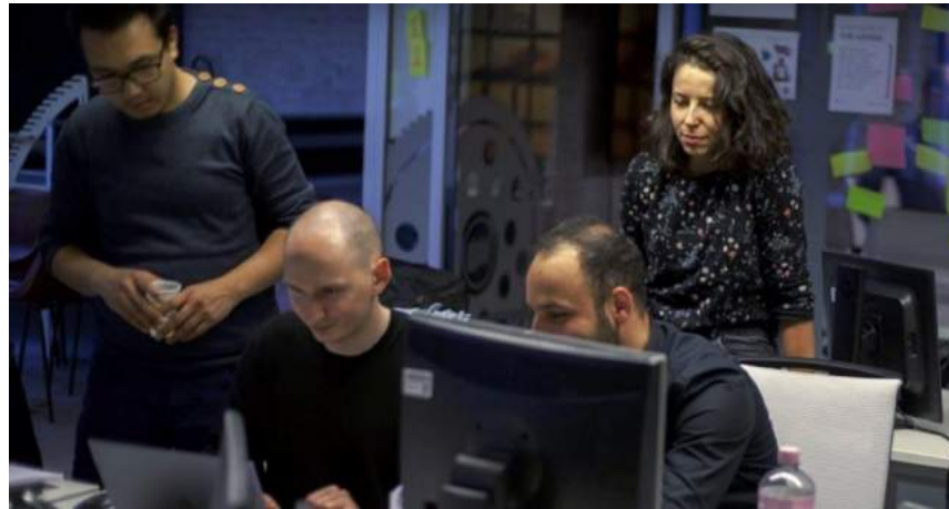
Social Innovation in der beruflichen Weiterbildung